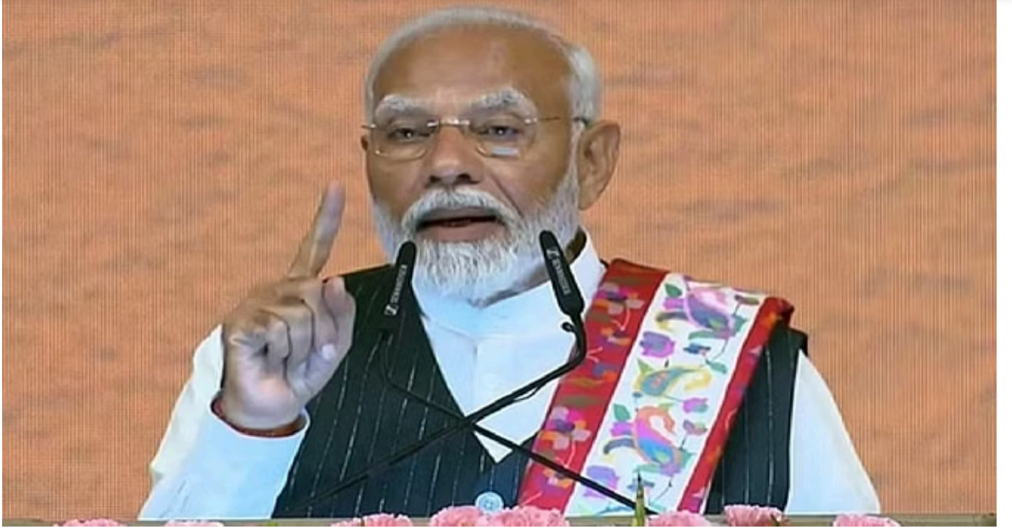
प्रधानमंत्री नरेंद्र मोदी